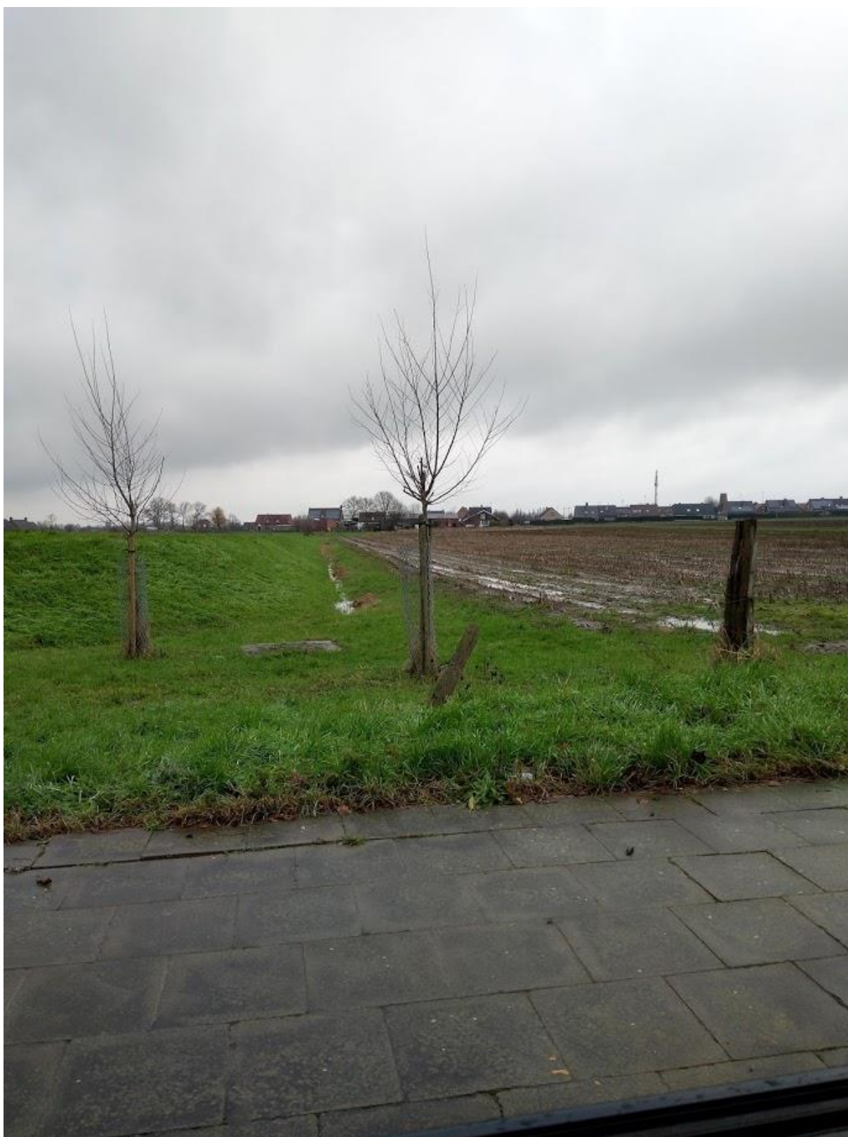
Foto vanaf de Koolskampstraat